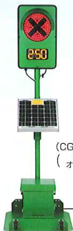
(CGS-1250S) (手動機能 オプション付)