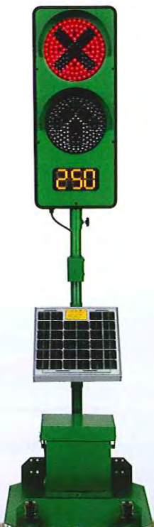
2灯式 CGS-2250S-K 可搬型立脚台仕様