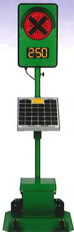
1灯式 CGS-1250S-K 可搬型立脚台仕様