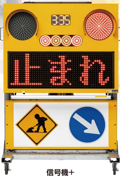
信号機+ メッセージ表示