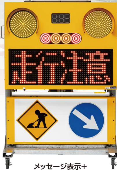
メッセージ表示+ プリンカー(黄色)交互点灯 ※信号機を使用しない場合